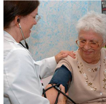
Ampliación del Acceso al Cuidado de la Salud y a Otros Servicios