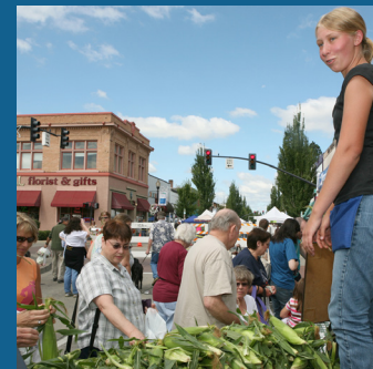
Mercados agrícolas más amplios