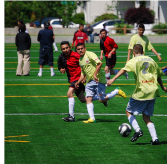
Nuevos Lugares de Reunión Comunitaria

¿En realidad cuánto afecta el tener una visión de la comunidad? En Hillsboro, la respuesta es “mucho” y la evidencia se encuentra en todas partes. Estas fotos capturan solo algunos ejemplos de los muchos resultados visibles del esfuerzo original de la Visión. La mayor parte de las 180 prioridades de la comunidad incorporadas en la Visión y Plan de Acción de Hillsboro 2020 se han ido implementando desde el año 2000. Ya sea que hayan sido proyectos especiales de una sola vez, o programas en curso constante, cada una de estas acciones ha ayudado en el avance de Hillsboro a hacer realidad nuestra Visión compartida de la comunidad.