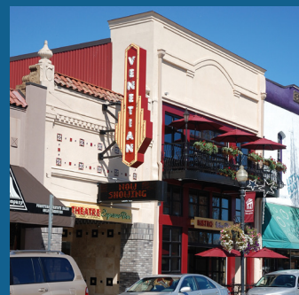
Nueva inversión urbana en downtown