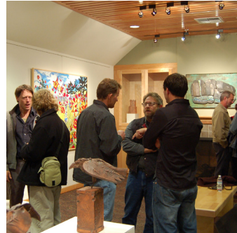
Centro Cultural Artístico Walters