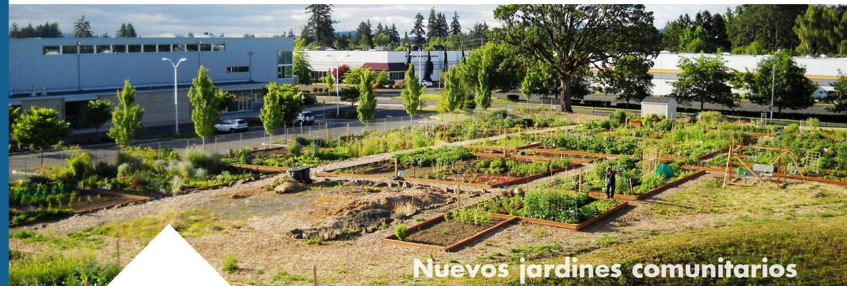
Nuevos jardines comunitarios