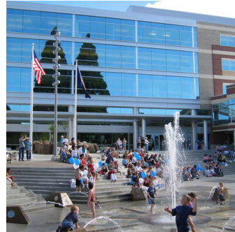
Centro Cívico de Hillsboro y Plaza Comunitaria Tom Hughes