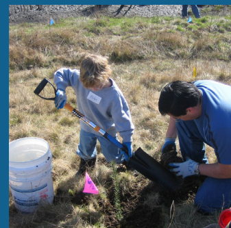
Plantación de árboles nativos en áreas críticas del hábitat