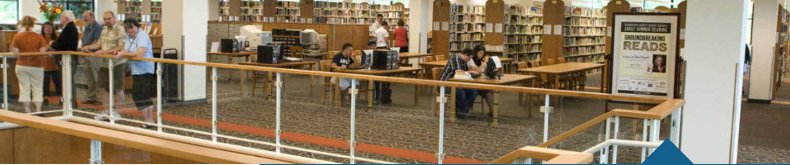
Biblioteca Principal Ampliada y Renovada