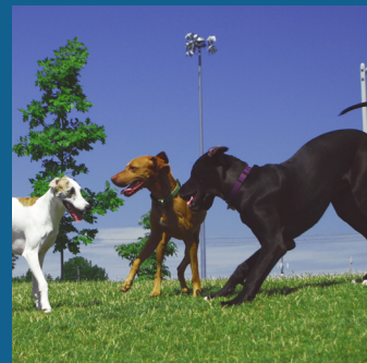
Parque Hondo para perros sin correas