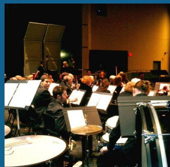
Actuaciones más amplias musicales y de teatro