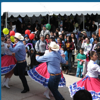
Festival Latino de Hillsboro