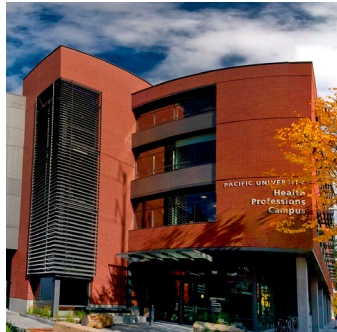
Inversión y Diversificación Económica en Crecimiento