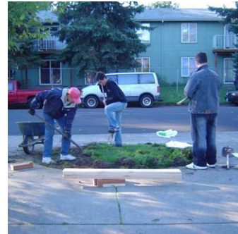
Días de Limpieza Comunitaria de Voluntarios SOLVE