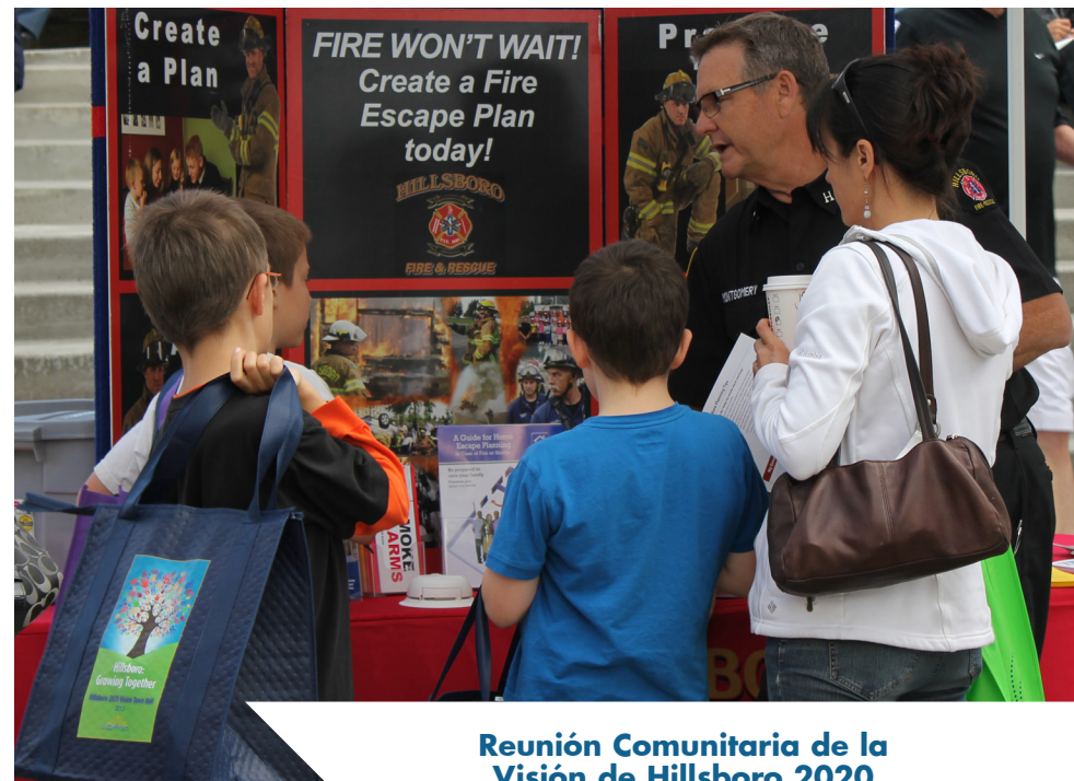
Reunión Comunitaria de la Visión de Hillsboro 2020