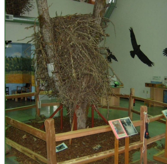
Mejoramiento a la Preservación de los Terrenos Pantanosos Jackson Bottom