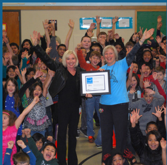
Escuelas eficientes en uso de energía